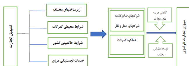
شکل ۲. چارچوب تحلیل مسیر در تجارت فرامرزی

بر این اساس با بهره‌مندی از نظریه هزینه مبادله، یک مدل مفهومی از تأثیر عوامل محیطی تسهیل‌کننده تجارت بر مقیاس معاملات تجارت فرامرزی در شکل (۲) ارائه شده است: