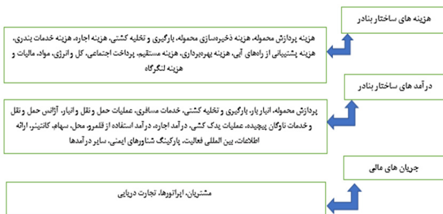
شکل ۱. مدل ارزش افزوده ایجاد شده ناشی از اقتصاد دریا محور در بنادر

در این راستا یکی از رویکردهایی که برای تعیین تأثیر اقتصاد دریا بر تجارت دریایی هر کشور پیشنهاد شده است، رویکرد ارزش افزوده ایجاد شده توسط کلیه بنگاه‌ها یا فعالیت‌های اقتصادی در بنادر تجاری بوده که بر این اساس مدل ارائه شده در شکل (۱) منابع ارزش آفرینی در بنادر تجاری دریایی را نشان می‌دهد (نینو و نیتسنکو (Nyenno & Nitsenko) ۲۰۱۷: ۱۵۷).